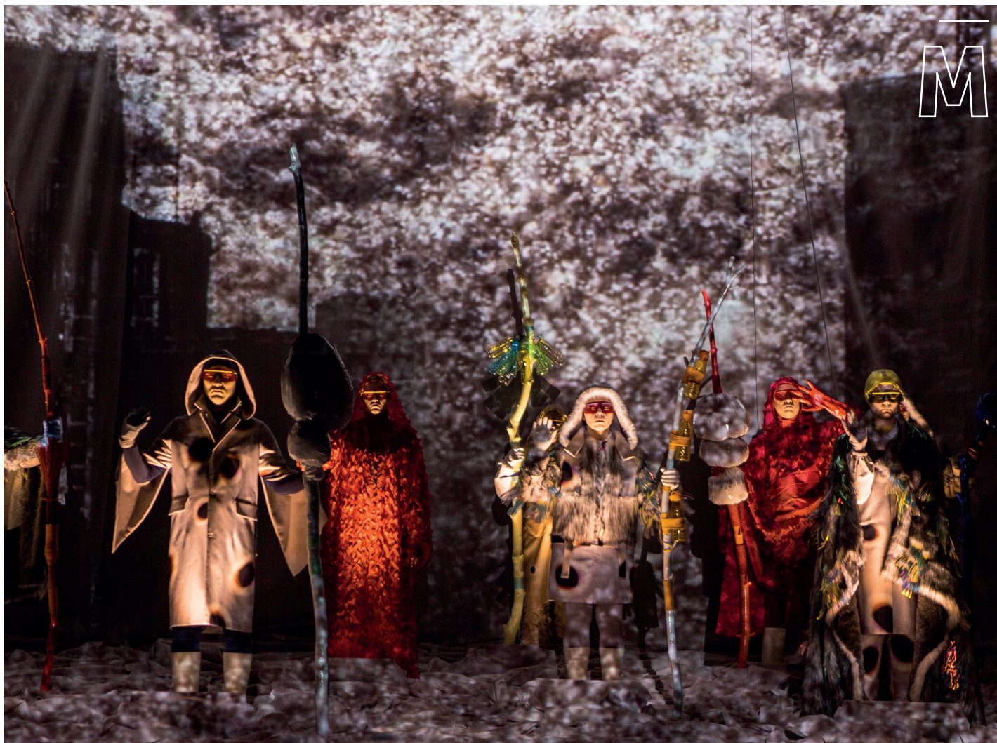
Scene uit NeoArctic .

'Hypnotiserende electrobeats voeren je mee naar dat andere Hooglied van doemdenkers: Koyaanisqatsi van Philip Glass.'