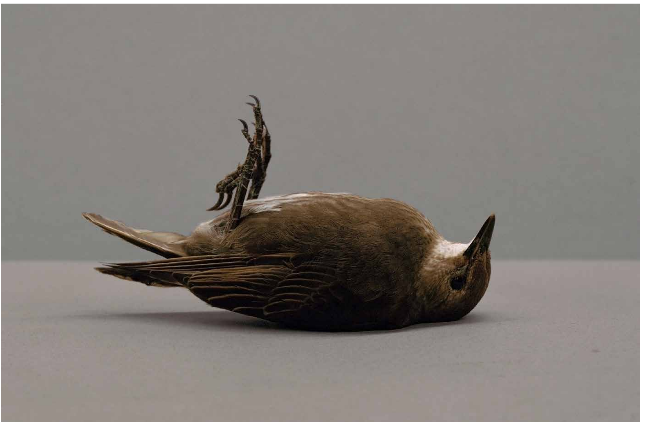
Tom Callemin Starling (Tonic Immobility) 2022