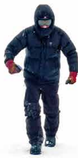
Geert Goiris Whiteout #22 (Ganzfeld) 2008

een whiteout bevindt, kan zelfs hallucinaties ervaren. Ook de kijker loopt kans zintuiglijk en emotioneel gedestabiliseerd te raken door Goiris' beelden. Er openbaart zich immers een andere dimensie van de werkelijkheid, die tegelijk vertrouwd en ongerept, maar ook dreigend en ontregelend aanvoelt. Waar tijd en ruimte onbetrouwbaar zijn en het onderscheid tussen wat leeft en niet leeft op de proef wordt gesteld.