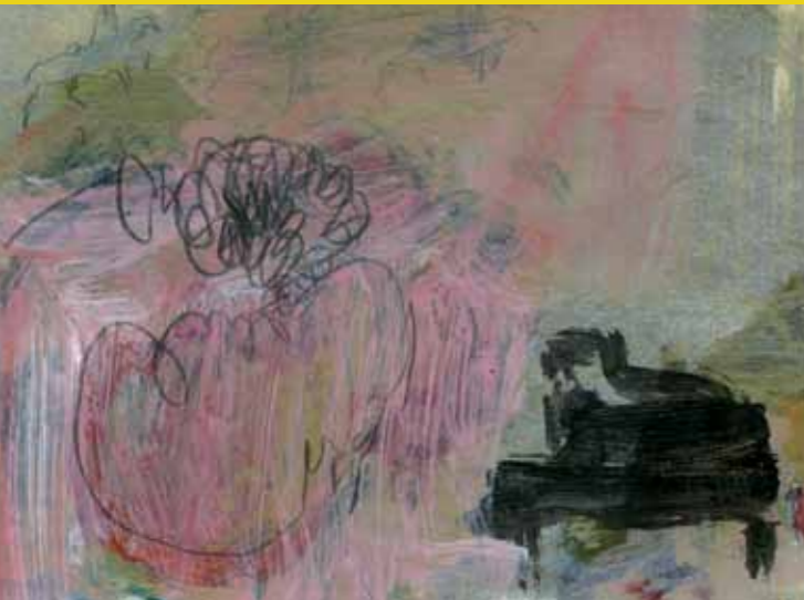
Mephisto, acryl en goudverf op papier op doek, 13 x 18 cm, 2011

Naar aanleiding van deze tentoonstelling wordt de catalogus In residence met inleidende teksten van Lotte De Voeght en Peter Delpout uitgegeven en in het cultuurcentrum te koop aangeboden.