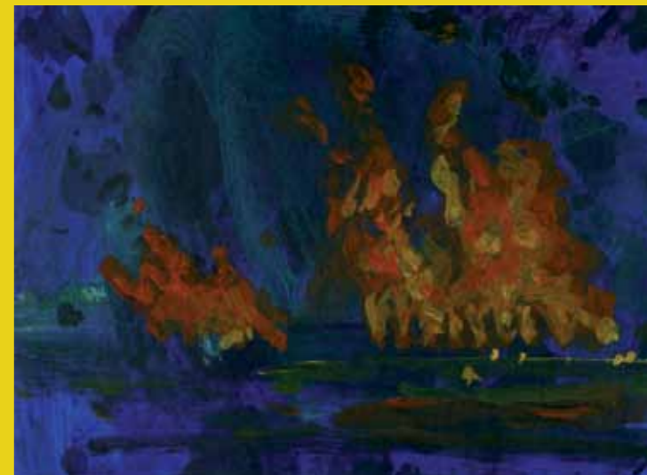
Bagdad, acryl op papier, 18 x 25 cm, 2008