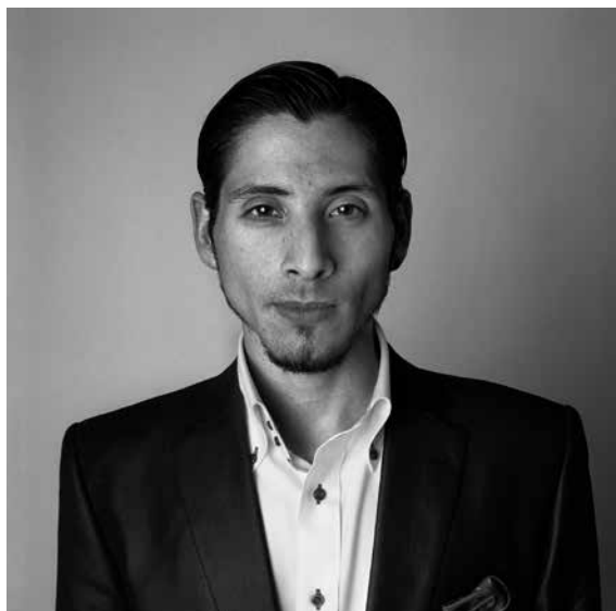
La cara del tango © Malou Swinnen