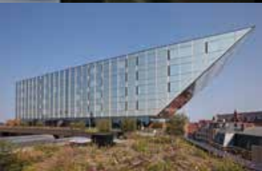
't Scheep (Stadhuis Hasselt)