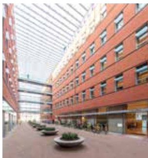
Vlaams Administratief Centrum (VAC) - Hendrik van Veldeke