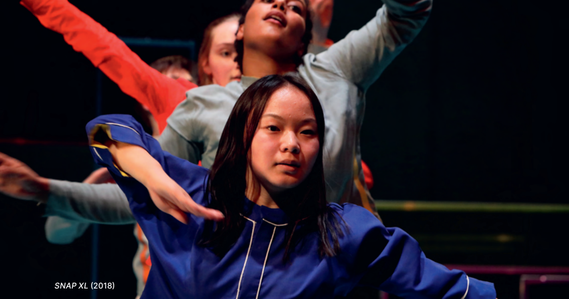
SNAP XL (2018)