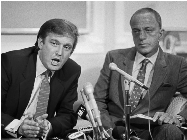
Donald Trump, Roy Cohn

Met Trump was Cohn in zaken, zoals hij tevoren de juridische belangen van de maffia van New York had gediend. Net zoals voor Trump bleef de grens tussen zaken en politiek voor Cohn altijd erg dun. Beiden zagen politiek tenslotte slechts als het snijpunt van macht en geld, en daar was het hen altijd om te doen. Hun persoonlijke motivatie lag in een fragiel zelfbeeld, getekend door kwetsbaarheid, wraakzucht en angst voor afwijzing en vernedering. In hun perceptie is het leven een oorlog, waarin alleen winnaars en verliezers kunnen bestaan. En zij wilden met alle middelen winnen – in de vorm van geld en macht, met publieke erkenning bovenop. Daar past die ‘directe’ stijl bij: bluffen, pesten, vernederen, intimideren, liegen, lasteren, manipuleren, aanvallen, nooit toegeven. In de scheldwoorden die Trump voor zijn critici en politieke opponenten bedenkt, kan geen verwijt erger klinken dan dat ze losers zijn. Omgekeerd houdt hij zijn kiezers stevast voor dat ze met hem als president zo vaak en zo veel zullen winnen dat ze het winnen uiteindelijk zelfs beu zullen worden.