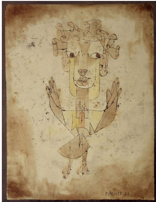
Angelus Novus © Paul Klee

(Tony Kushner in Vrij Nederland , 9 oktober 2004)