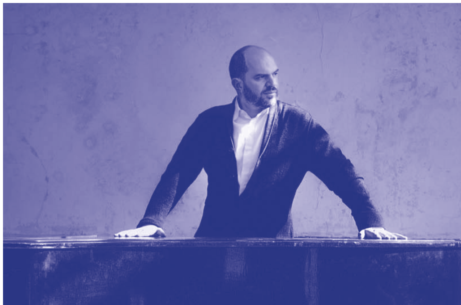
Kirill Gerstein