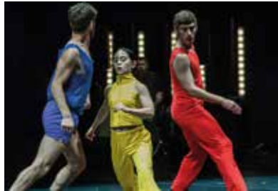
Jan Martens/GRIP © Phile Deprez