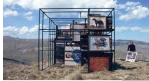
Taus Makhacheva - Tightrope , 2005