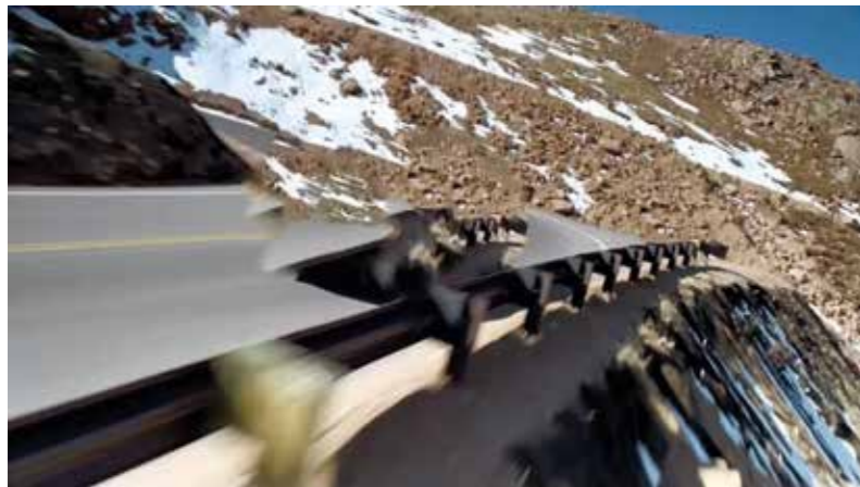
Zach Nader - Optional Features Shown - Courtesy of the artist and Microscope Gallery- 2012

In 2002 richtte Thierry Vandebussche in Gent het courtisane festival voor film, video en media op. Later specialiseerde hij zich binnen het kunstplatform Outlandish in fotografie. In 2014 richtte hij still gallery op die de zoektocht naar nieuwe fotografie verder zette.