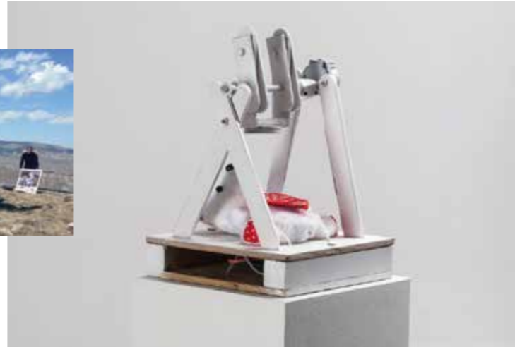
Roel Brink - I love you , 2018