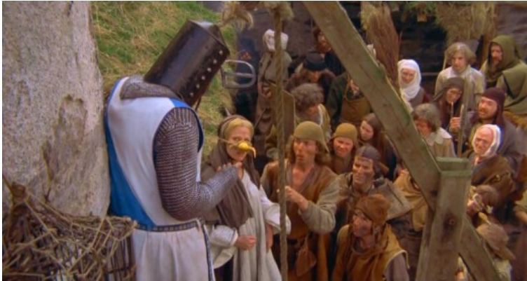
Heksenvervolging / Monthy Python filmfragment