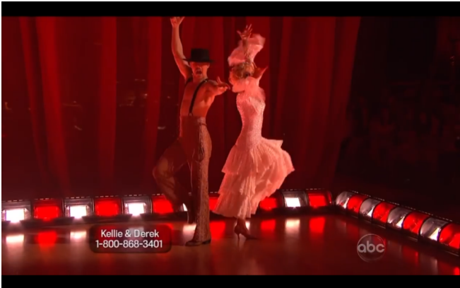
Flamenco / Dancing With The Stars filmfragment

https://www.youtube.com/watch?v=yp_l5ntikaU