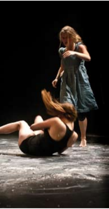
A la limite

CREDITS concept & regie Leen Lacroix en Marieke Breyne • spel Jolien Naeyaert & Kim Snauwaert • geluid Koen Van Overmeiren • © Marien Van Overbeek • www.mosterdmetzaad.be